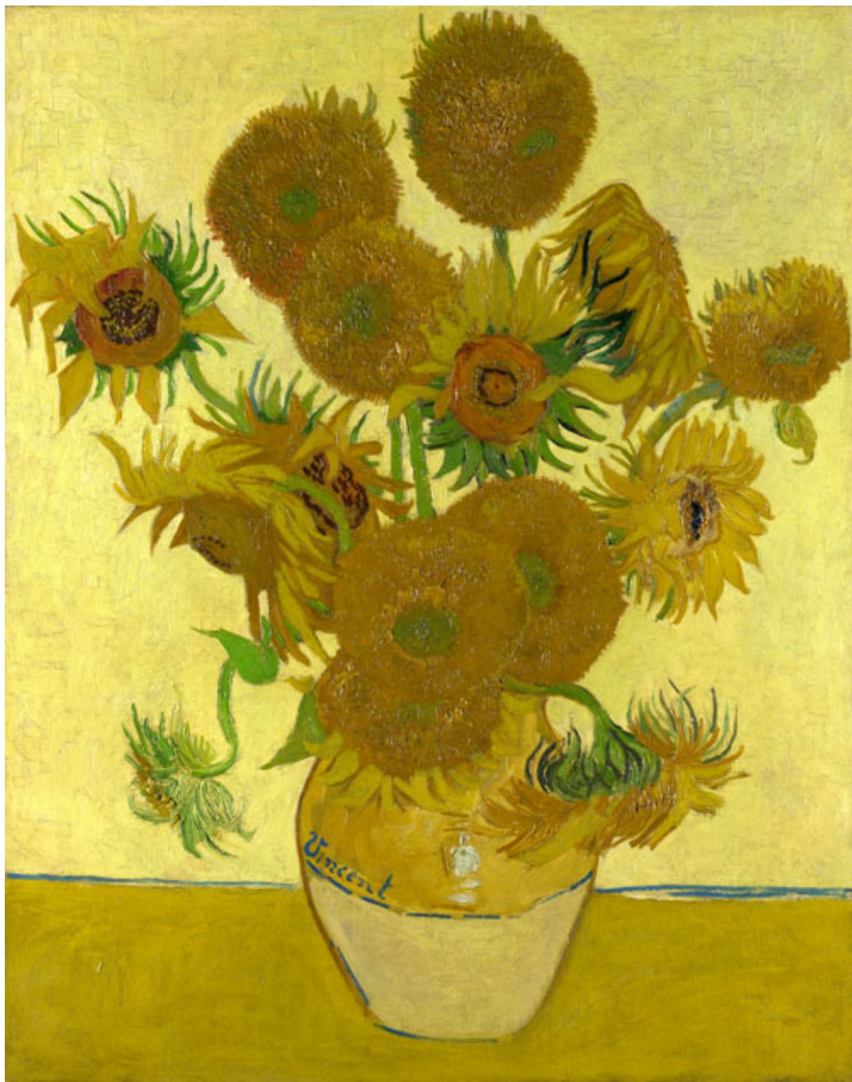
花瓶裡的十四朵向日葵 Sunflowers