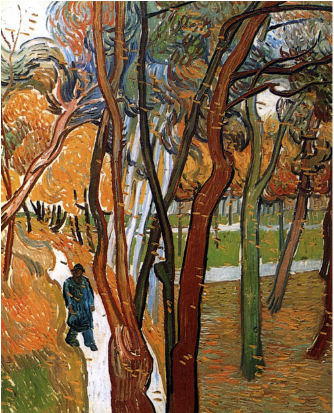
聖保羅醫院花園_落葉 The Garden of Saint Pauls Hospital (The Fall of the Leaves)1889