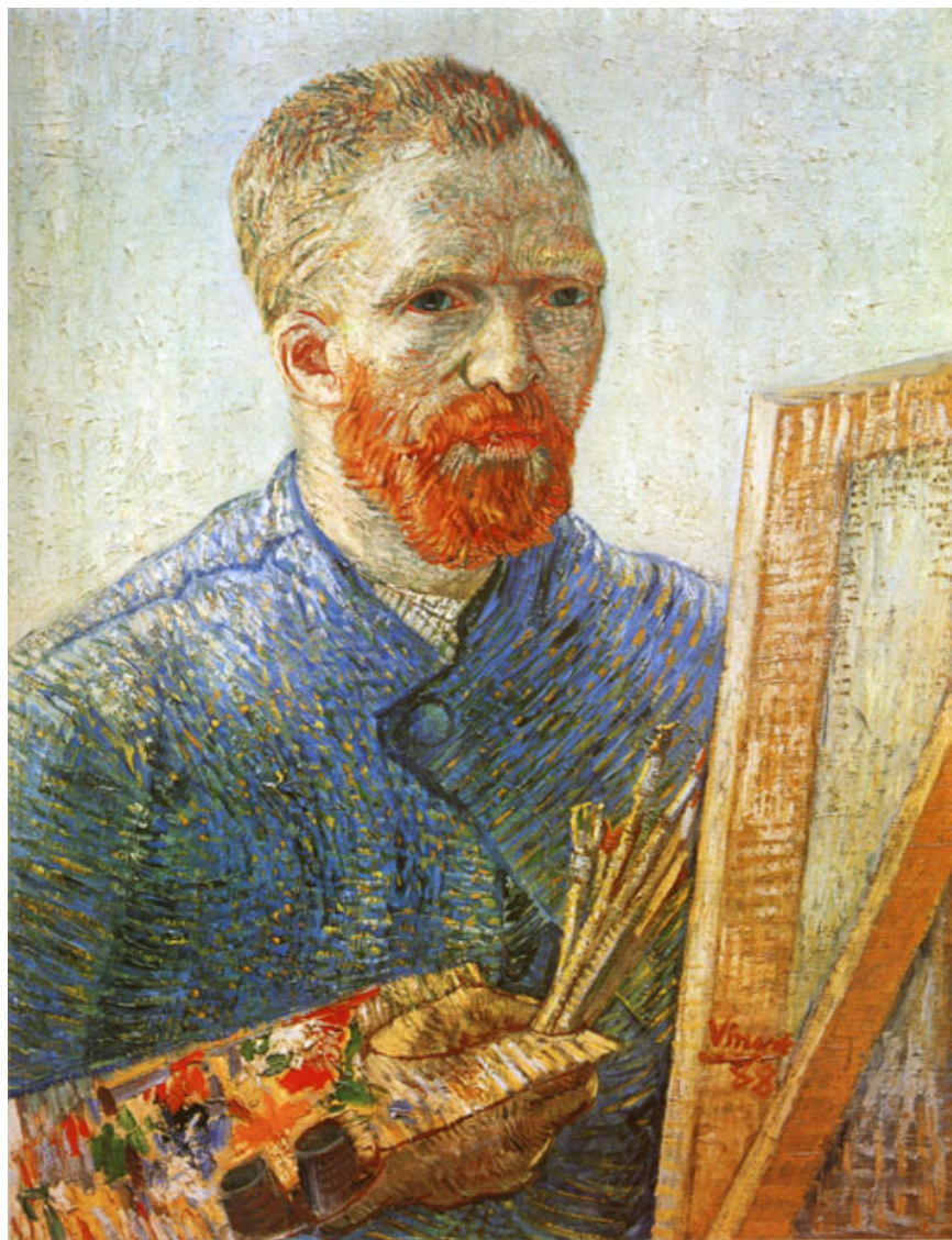
藝術家的自畫像 Self-Portrait as an Artist , 1888