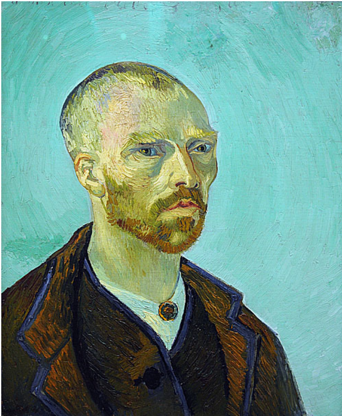
獻給高更的自畫像 Self-Portrait Dedicated to Paul Gauguin 1888

梵谷 27 歲才開始他的畫家生涯，受到他的表兄以及當時荷蘭一些畫家短時間的指導，並於巴黎認識了幾位新起的畫家，其中以高更最好朋友。