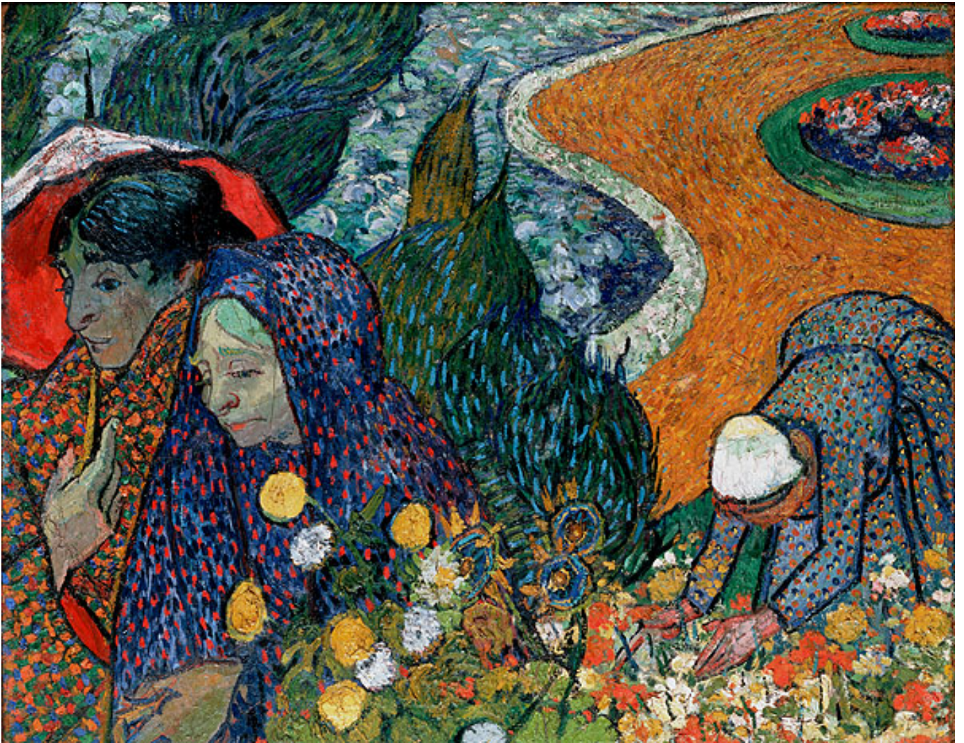
阿爾的女士們 Memory of the Garden at Etten (Ladies of Arles) , 18888

梵谷在阿爾（Arles）定居時已畫出了兩百多幅的畫，但卻沒有賣出任何畫作，十分貧窮。