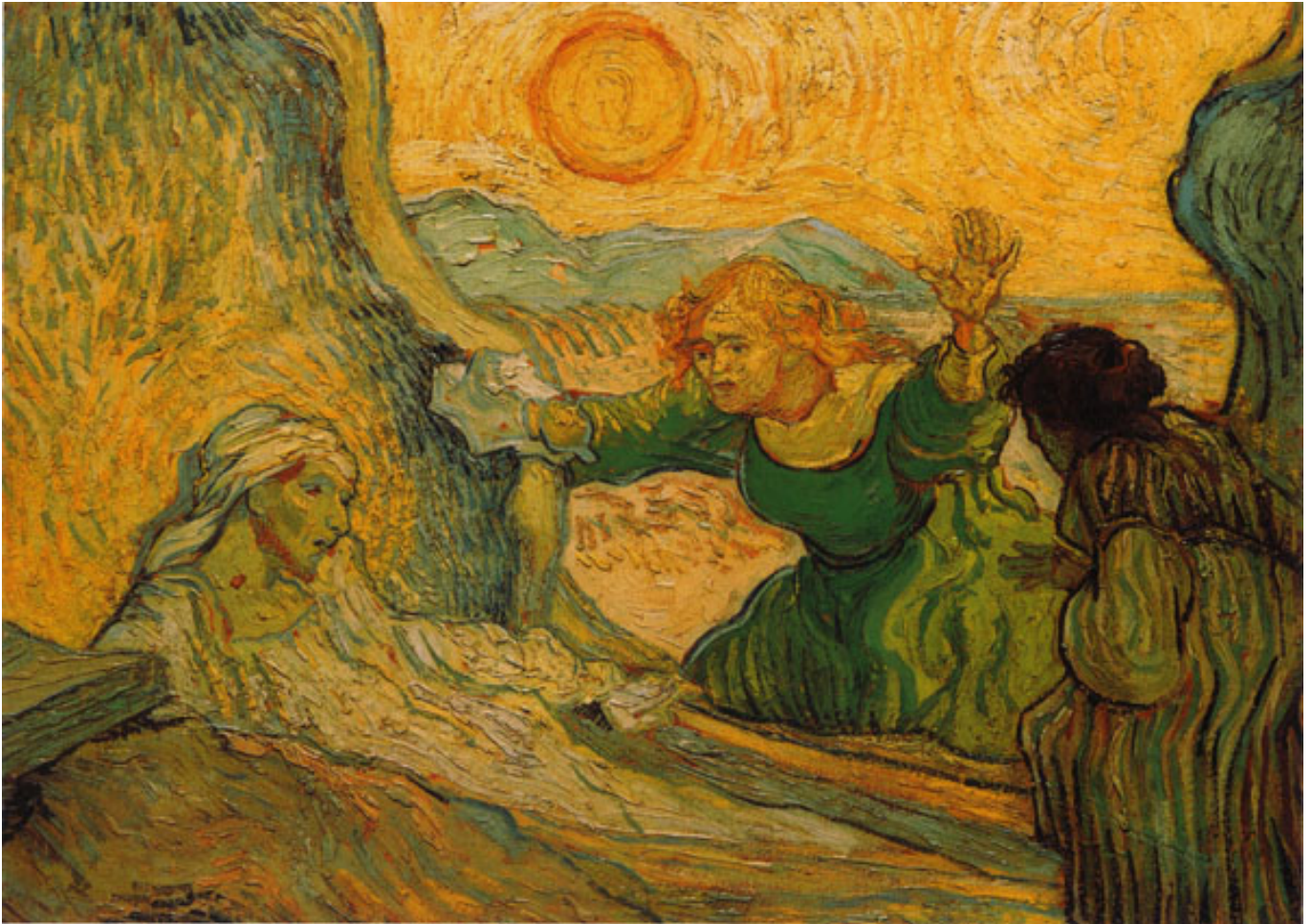
病人復甦 The Raising of Lazarus (after Rembrandt) 1890