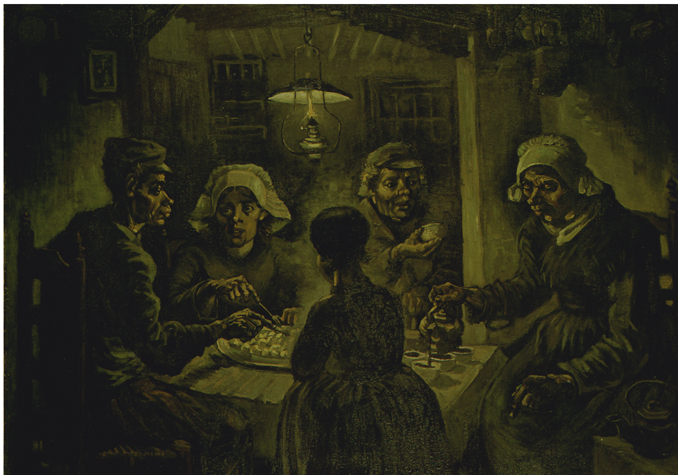
吃馬鈴薯的人(The Potato Eaters),1885 年

梵高受著牧師父親的影響，很同情窮人，自願到貧困採礦工人的傳教，曾於礦坑爆炸時冒死救出一個重傷的礦工。