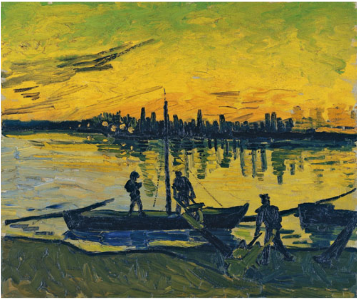
阿爾的碼頭工人 The Stevedores in Arles, 1888