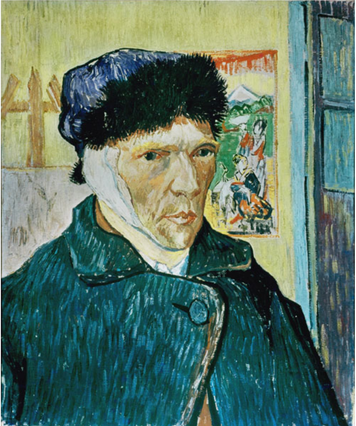
割耳後的自畫像 Self Portrait with Bandaged Ear, 1889

梵高精神困擾，後來和高更吵了一場，結果還自己切掉了左耳。從此，他不但失去高更這個好朋友，還給所有人笑作瘋子。