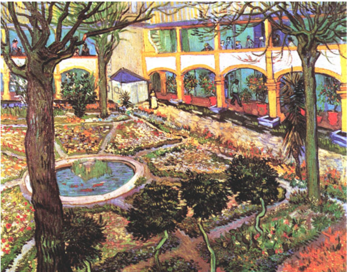
阿爾醫院的庭院 The Courtyard of the Hospital at Arles 1889