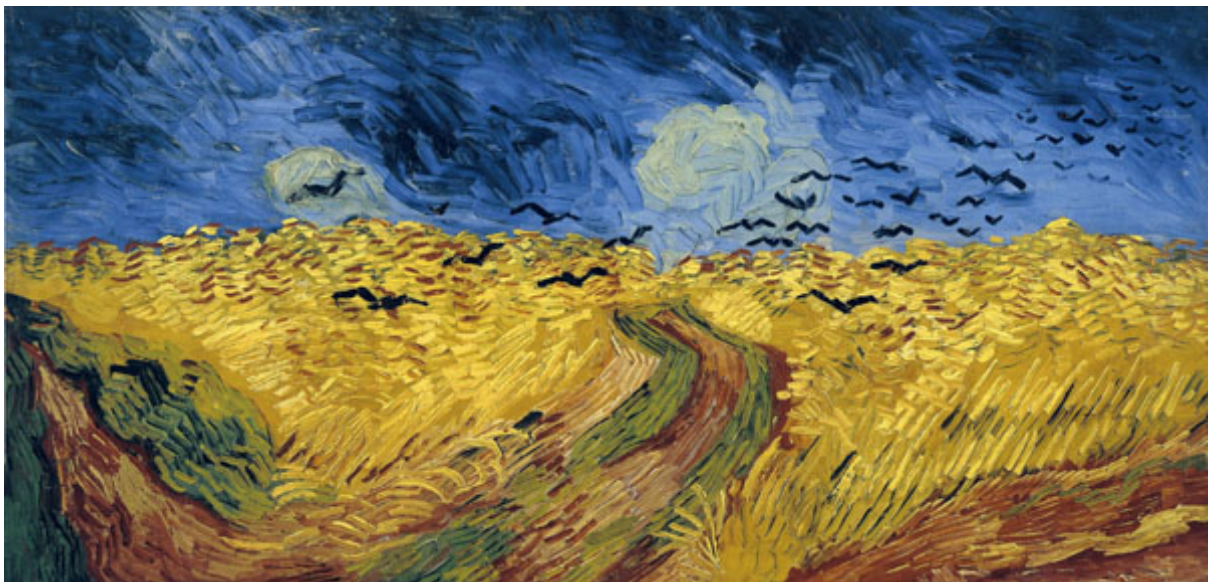
麥田群鴉 Wheatfield with Crows 1890