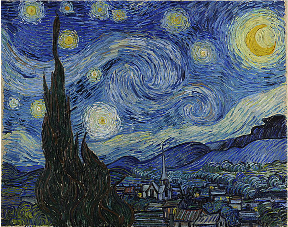
星夜 The Starry Night 1889