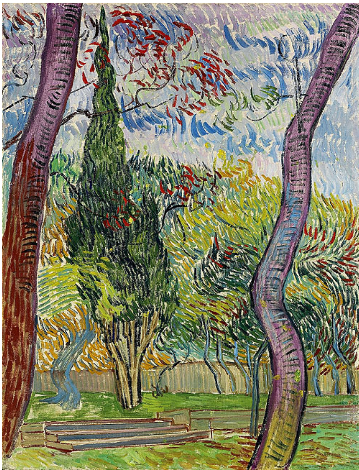
聖保羅醫院公園 Parc de l'hôpital Saint-Paul 1889